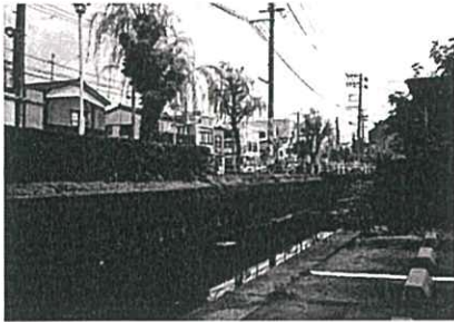
川の両側で堤防の高さが違う。 もし水があふれたらどうなるだろう。