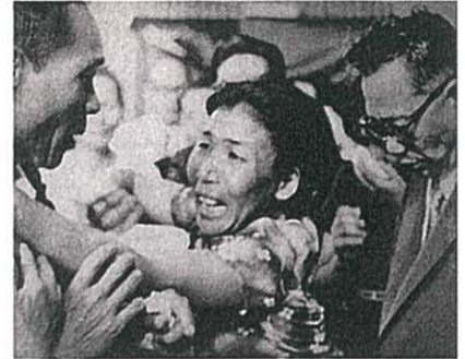
「息子をかえせ」とせまるIさんの父親とそれを 止めるIさんの母親。